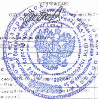
График работы медицинских работников участвующих в предоставлении платных медицинских услуг за июль 2020